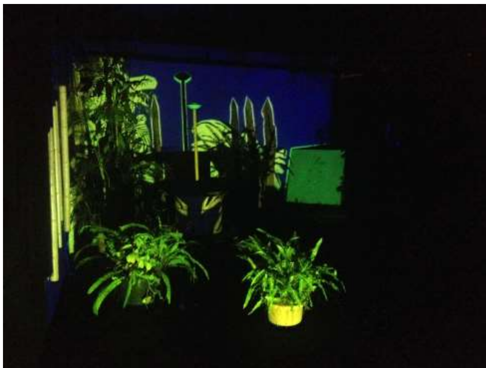
Figura 3. Vista general de Abducción en el palenque Centro Cultural de España en Costa Rica: Obra y fotografía de los autores Luis Gárciga y Loreto Alonso. (2018).

José Luis Brea considera tres eras de la imagen, una matérica, otra fílmica y otra electrónica llamada e-imagen, con características muy particulares que las distinguen, la fotografía carece de ese pasado matérico y se inscribió desde su aparición en una imagen-film, luego continuó su desarrollo pasando a su condición electrónica, analizada por Brea como postfotografía 19 . Como se insistía anteriormente, la fotografía ha rebasado ese instante, situándose electrónicamente ubicua y pervasiva. En el artículo Fotografía ahora. El tercer obturador y las emergencias postmediales 20 , se defendía como los agentes geolocalidad, relacionalidad, comunidad, territorialidad, amateurización, portabilidad y documentabilidad son elementos que obturan por una tercera vez.