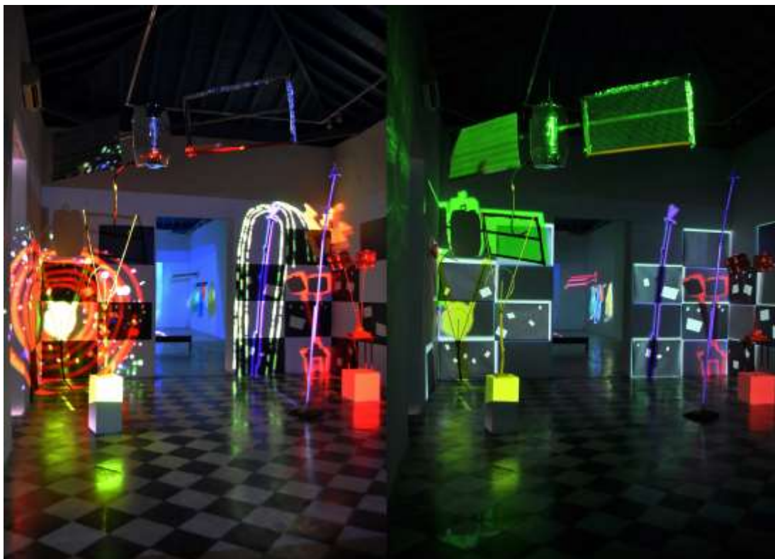
Figura 1. Vista general en dos instantáneas de Punto WiFi y línea sobre el plano en el Centro de Arte Contemporáneo Wifredo Lam. La Habana: Obra y fotografía de los autores Luis Gárciga y Loreto Alonso (2016)

Esta condición aumentada y mixta nos remite a dos antecedentes importantes: el cine expandido 6 y a la escultura expandida 7 . Como referencias de obras inscritas en estos antecesores mencionaremos a las piezas escultóricas con videoproyecciones de Tony Oursler o las de esculturas abstractas que proyectan sombras figurativas de Tim Noble & Sue Webster, mientras que en el cine expandido filiado en el llamado cine estructural señalamos los llamados filmes de luz sólida de Anthony McCall, en particular Línea describiendo un cono (1973).